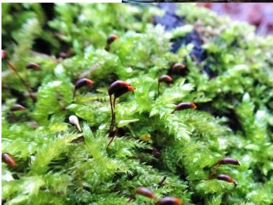
Gewoon dikkopmos met kapsels